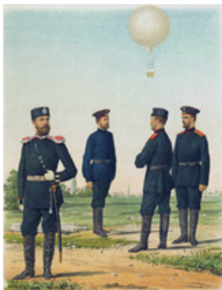
Обер-офицер и рядовые воздухоплавательного парка